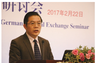
无锡市卫计委副主任胡建伟发表致辞