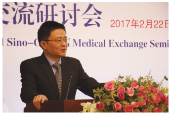
无锡市梁溪区区长秦咏薪发表致辞